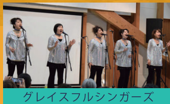
グレイスフルシンガーズ

10/19(土) 来場者先着1,000名様に 猿倉温泉 共通入浴券をプレゼント!! (フォレスト鳥海・鳥海荘)