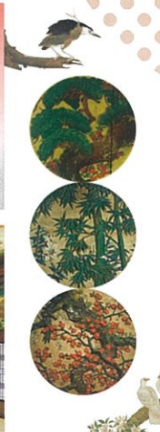
①東西東西／七原しえ ②つるし飾り／花工房猪子鹿 ③組子かざり春夏秋冬／江戸組子建松 ④てまり／はれてまり工房 ⑤日々福／もりわじん ⑥打掛／ホテル雅叙園東京所蔵 表面：白梅紅梅／七原しえ ※キャプション記載のないものは全て文化財「百段階」内美術品 ※画像はイメージです。展示作品は変更となる場合がございます。