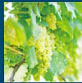
ワイン用のぶどう (イメージ)