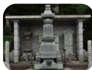
妙慶寺 （御田の方の墓碑）

集合場所：歴史保存伝承の里 天鷲村 行程時間：約2時間、歩行距離5km、追加料金：妙慶寺拝観料300円 行程：天鷲村⇒亀田城跡地⇒天鷲神社⇒ 養福院跡地⇒妙慶寺⇒佐々木家⇒龍門寺⇒戻り 催行者：岩城まち歩き案内人の会