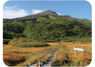
竜ヶ原湿原と鳥海山