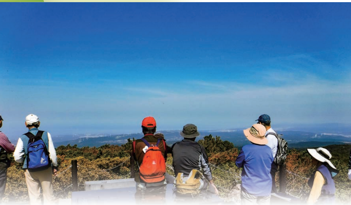
<写真> コース② 祓川展望台より日本海を望む（鳥海山矢島口5合目付近）